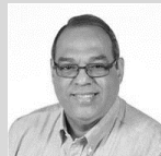
Ángel (Chayanne) Martínez